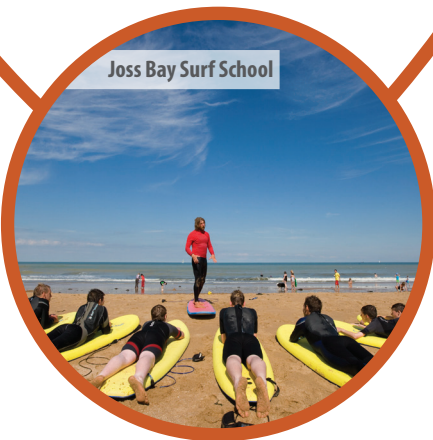
Joss Bay Surf School