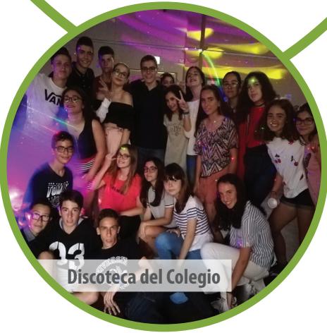
Discoteca del Colegio

Las familias de acogida están a cargo de las comidas de nuestros estudiantes, dándoles el almuerzo para llevar diariamente.