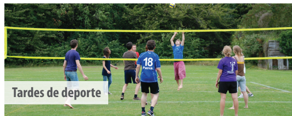
Tardes de deporte

La información contenida en el presente folleto es correcta en el momento de la impresión. Consulte nuestra página web para obtener más detalles sobre nuestros servicios y conocer la información más actualizada. Las imágenes de la portada incluyen fotos de la discoteca del Colegio, escalada, estudiantes en una excursión por Dover y por Baia Louisa.