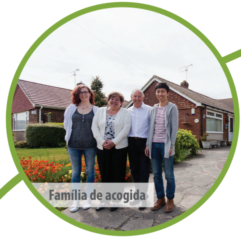
Familia de acogida

Nuestras instalaciones también incluyen una mesa de billar, juegos de mesa, fútbolín, wii, televisión, una pequeña biblioteca y un jardín agradable.